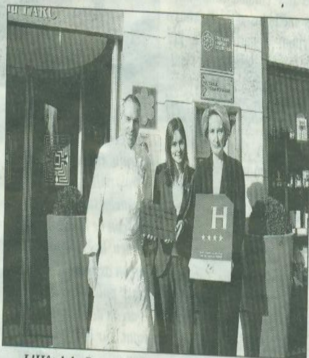
L'Hôtel du Parc : tout le confort d'un grand hôtel et toute la convivialité d'une maison d'hôte.

L'hôtel du Parc propose à ses clients des chambres uniques ouvrant sur une table étoilée au guide Michelin. « Nous souhaitons aller vers l'excellence et la progression de la qualité de notre établissement. Les quinze chambres sont contemporaines, parfait